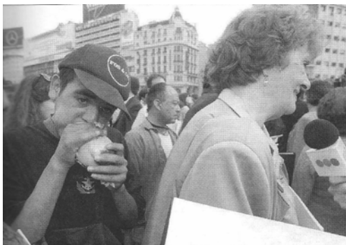
POLITICOS. Están más expuestos a ser investigados cuando la información involucra un interés

Entonces, como los medios tienen la obligación de informar, los receptores –entendidos como entes participativos- poseen el derecho a estar informados. Sucede que se vuelve imprescindible para la humanidad conocer hechos (noticias e informaciones), ideas y opiniones tanto buenas como malas. Así como también, aquello que compromete el interés público hasta lo de menor trascendencia. Aunque Pizarro expresa que ese límite se quiebra cuando el servicio social invade la vida